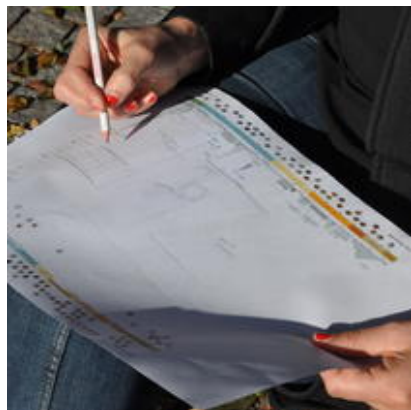
Croquis sur le terrain - analyse de site JNAC 2017

Châlons en Champagne / Joinville / Reims / Troyes / Charleville-Mézières 11/2017 - 06/2018